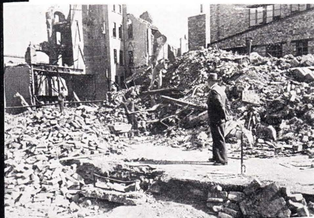
Verlagsgebäude der R-N

Die bisherigen Erfolge sind für uns Verpflichtung und Ansporn zu weiterer Leistungssteigerung.